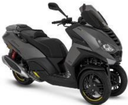
Peugeot Metropolis GT Farbe: Satin Titanium