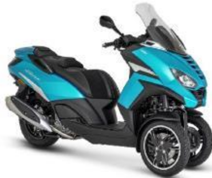
Peugeot Metropolis Allure Farben: Snow White, Sideral Mat Black, Midnight Blue, Amazonite Satin Blue