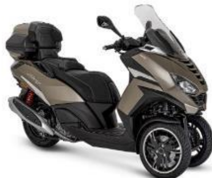
Peugeot Metropolis SW Farben: Snow White, Sideral Mat Black, Midnight Blue, Smoky Quartz Satin

UVP Peugeot Metropolis Active (400 ccm): ab 9.289 Euro