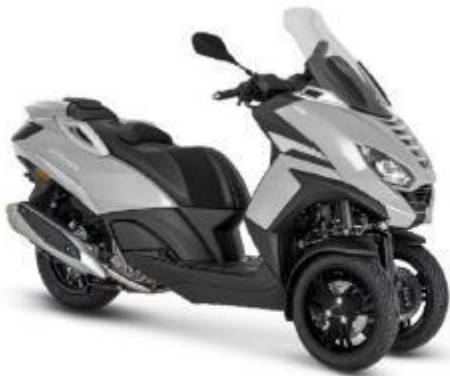
Peugeot Metropolis Active Farbe: Varnish Technium

Mit der gleichzeitigen Markteinführung des Peugeot Metropolis SW und des Peugeot Metropolis GT ist Peugeot Motocycles stolz darauf, das französische Know-how hervorzuheben, das die über 120-jährige Geschichte der Marke fortführt. Die Peugeot Metropolis-Familie besteht nun aus den Versionen Active, Allure, SW und GT.